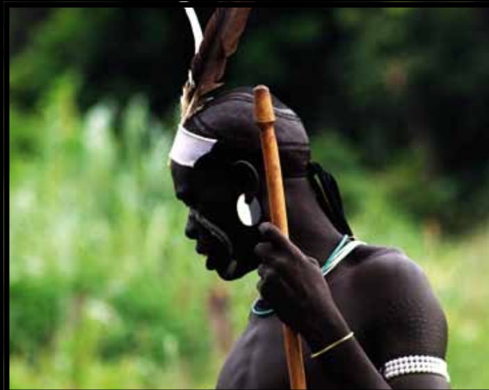
• Mężczyźni Mursi walczą ze sobą w pojedynkach nazywanych donga . Ich bronią jest długi na ok. 3 metry kij.