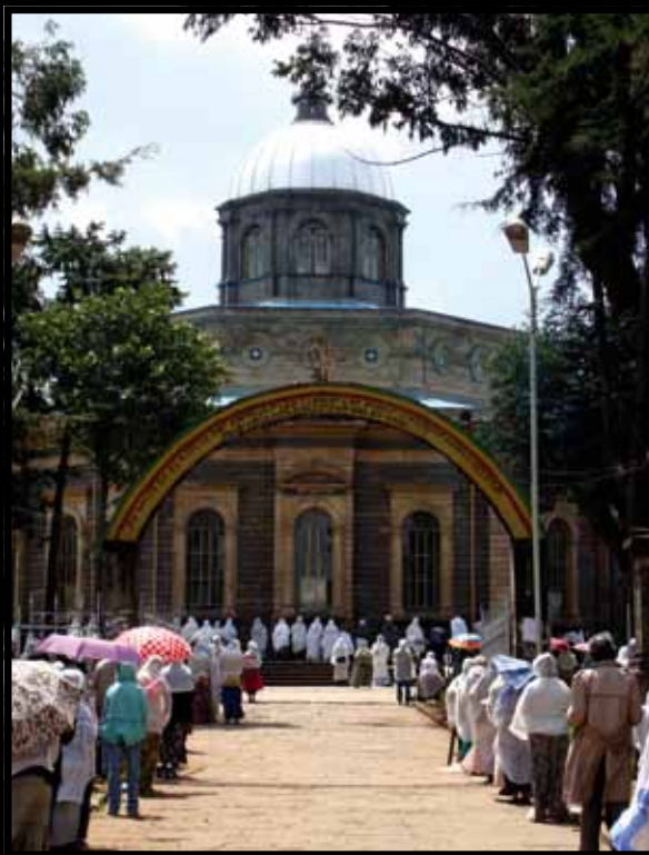
• Najświętszą świątynią w Addis Abebie jest Kościół św. Jerzego, w którym w 1930 r. został koronowany na cesarza Haile Selassie I