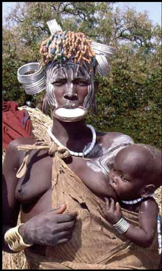
• Oprócz krążków w wardze i uszach, kobiety Mursi zdobią swoje ciała za pomocą białej farby, kłów guźców, metalowych obręczy, piór i barwionych skórzanych szat

pomyślnie zakończone dają prawo do ożenku i założenia rodziny. W ten sposób wprowadza się chłopca ( ukuli ) w dorosłość. Dodatkowym elementem tej ceremonii, kompletnie niezrozumiałym dla Europejczyków, jest biczowanie kobiet, w którym bierze udział cała rodzina. Nad jego organizacją czuwają maz , czyli ci, którzy już przeszli pomyślnie inicjację, ale jeszcze nie wstąpili w związek małżeński. Do ich obowiązków należy dostarczenie długich, giętkich gałęzi do biczowania. Kobiety, których skóra w całości pokryta jest tłuszczem zwierzęcym, tworzą